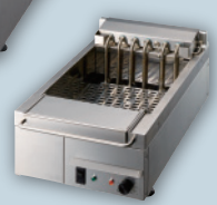
■電気ディーフライヤー 天ぷらと揚げ物の料理に