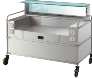
モバイルタイプ3連型 RBSVACS3