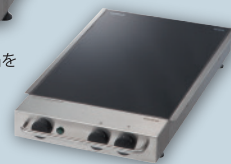
■電気クッキングヒーター 保温やIH未対応の調理器具に