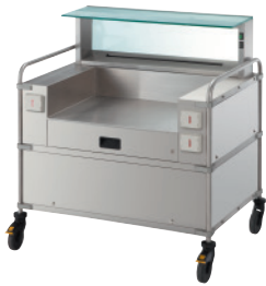
モバイルタイプ2連型 RBSVACS2