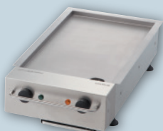
■グリドルシングル グリドル料理に最適な2つのサイズをご用意

組み合わせ自由に選定 6つの調理機器は簡単に組み換え可能。ジャンルを問わない多彩なメニューに対応。