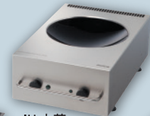
■IH中華 中華鍋を使った料理に