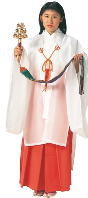
巫女装束(みこしょうそく)