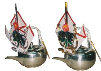
錫堤銚子(すずひさげちょうし) 蝶飾り付き1対