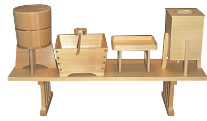
手水用具(てみずようぐ)