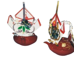
朱塗堤銚子(しゅぬりひさげちょうし) 蝶飾り付き1対