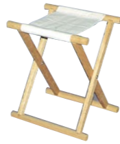
胡床(こしょう)A 相引型