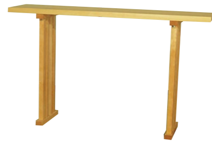
八脚案(はっきゃくあん)