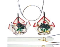
蝶飾り(ちょうかざり) 1対