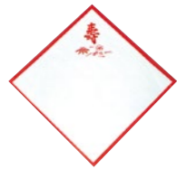
紅白紙(こうはくし)