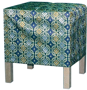
胡床(こしょう)A 角型