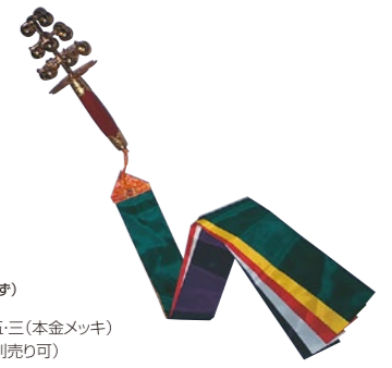
神楽鈴(かぐらすず)