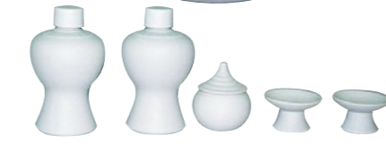
神殿用土器(しんでんようどき) 1式