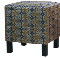
胡床(こしょう)C 角型