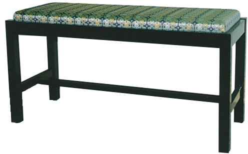
胡床(こしょう)ベンチ型