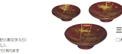
三ツ組盃(みつくみさかずき)桐箱入り1組