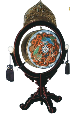
楽太鼓(がくだいこ)A