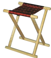
胡床(こしょう)C 相引型