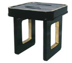
花月盃台(かげつさかずきだい)