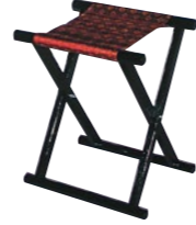
胡床(こしょう)F 相引型