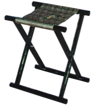
胡床(こしょう)D 相引型