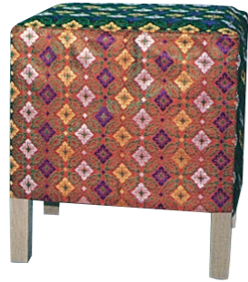
胡床(こしょう)B 角型