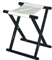
胡床(こしょう)B 相引型