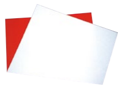
紅白紙(こうはくし)