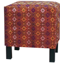
胡床(こしょう)D 角型