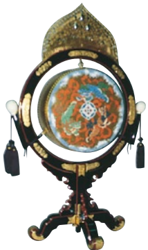
楽太鼓(がくだいこ)B