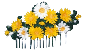
花簪(はなかんざし)