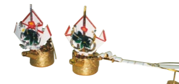
長柄銚子(ながえちょうし) 蝶飾り付き1対