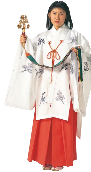
巫女装束(みこしょうそく)