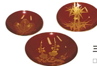
三ツ組盃(みつくみさかずき)紙箱入り1組