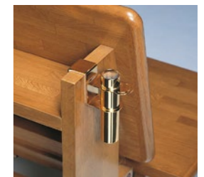
チャペルチェア用花器 CC-F