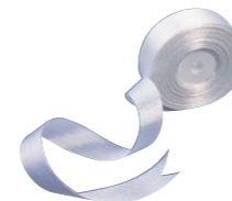
ホワイトリボンテープ