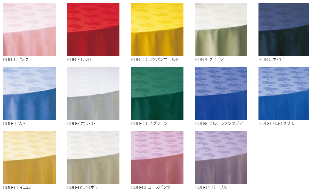
RDR-1 ピンク RDR-2 レッド RDR-3 シャンパンゴールド RDR-4 グリーン RDR-5 ネイビー RDR-6 ブルー RDR-7 ホワイト RDR-8 モスグリーン RDR-9 ブルーファンタジア RDR-10 ロイヤルブルー RDR-11 イエロー RDR-12 アイボリー RDR-13 ローズピンク RDR-14 パープル