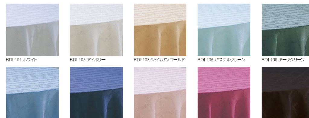
RDI-101 ホワイト RDI-102 アイボリー RDI-103 シャンパンゴールド RDI-106 パステルグリーン RDI-109 ダークグリーン RDI-110 ブルー RDI-113 ネイビー RDI-114 サーモンピンク RDI-116 ワイン RDI-125 ブラック