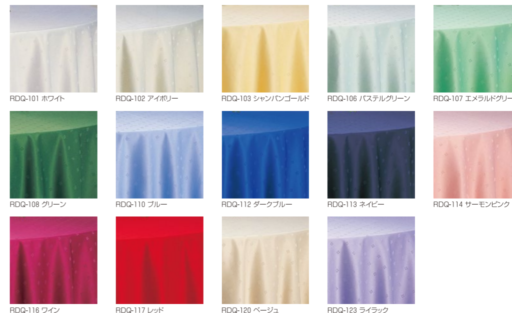
RDQ-101 ホワイト RDQ-102 アイボリー RDQ-103 シャンパンゴールド RDQ-106 パステルグリーン RDQ-107 エメラルドグリーン RDQ-108 グリーン RDQ-110 ブルー RDQ-112 ダークブルー RDQ-113 ネイビー RDQ-114 サーモンピンク RDQ-116 ワイン RDQ-117 レッド RDQ-120 ベージュ RDQ-123 ライラック