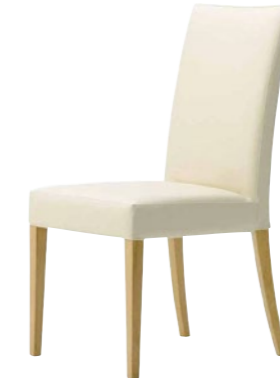
木製チェア メルカAM 5N

□外寸法/W455×D575×H905(SH450) □張地/レザーC □主材/ブナ無垢材 □重量/5.5kg