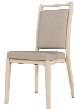
アルミニウムチェア DSCR-D53036

□外寸法/W440×D550×H905(SH450) □張地/ビニールレザー張り・ファブリック張り □脚部/アルミニウム合金 □スタッキング/5脚程度