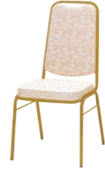
レセプションチェア MR-2H-GA

□外寸法/W465×D555×H910(SH445) □張地/ビニールレザー張り □脚部/19㊦スチールパイプ・ゴールド塗装 □重量/6.9kg