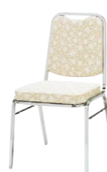
レセプションチェア MR-2-M

□外寸法/W465×D535×H815(SH445) □張地/ビニールレザー張り □脚部/19㊦スチールパイプ・クロームメッキ □重量/5.8kg