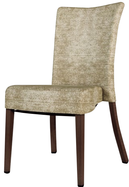
アルミニウムチェア DSCR-D55100

□外寸法/W510×D615×H925(SH450) □張地/ビニールレザー張り・ファブリック張り □脚部/アルミニウム合金 □スタッキング/5脚程度