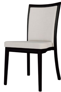
アルミニウムチェア DSCR-D52100B

□外寸法/W460×D600×H865(SH450) □張地/ビニールレザー張り・ファブリック張り □脚部/アルミニウム合金 □スタッキング/5脚程度