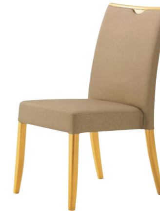
木製チェア トレン HM 5N

□外寸法/W470×D615×H870(SH430) □張地/布地C □スタッキング可能 □主材/ブナ無垢材 □重量/6.4kg