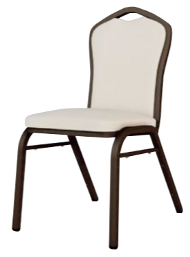
アルミニウムチェア DSCR-T17001

□外寸法/W450×D585×H880(SH450) □張地/ビニールレザー張り・ファブリック張り □脚部/アルミニウム合金 □スタッキング/10脚程度