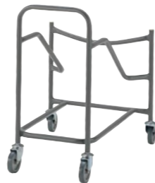
NSC-B50L 会議用チェア専用台車 DN-30

□外寸法/W588×D682×H752 □材質/25.4㊦スチールパイプ・焼付塗装仕上 □キャスター/100㊦ □収納台数/30脚 □重量/7.8kg