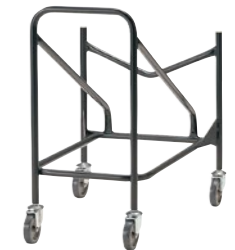
RC-13/15/M55 会議用チェア専用台車 D-30

□外寸法/W573×D700×H780 □材質/25.4㊦スチールパイプ・焼付塗装仕上 □キャスター/100㊦ □収納台数/15脚 □重量/8.6kg