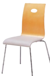
レセプションチェア MC-330NA-M

□外寸法/W550×D570×H860(SH450) □張地/ビニールレザー張り □背部/成型合板(両面メラミン貼り・ナチュラル) □脚部/15.9㊦スチールパイプ・クロームメッキ □重量/4.8kg