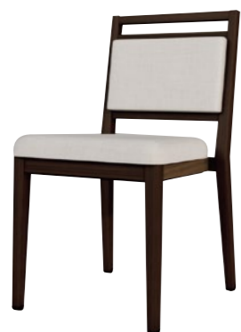
アルミニウムチェア DSCR-D53300

□外寸法/W440×D510×H800(SH450) □張地/ビニールレザー張り・ファブリック張り □脚部/アルミニウム合金 □スタッキング/5脚程度