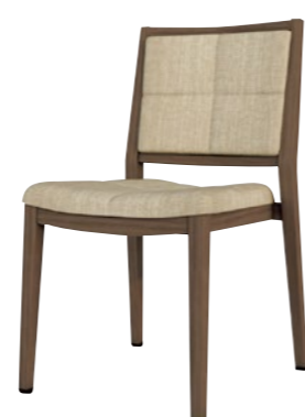
アルミニウムチェア DSCR-D53142

□外寸法/W480×D550×H850(SH450) □張地/ビニールレザー張り・ファブリック張り □脚部/アルミニウム合金 □スタッキング/5脚程度