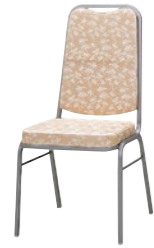
レセプションチェア MR-22H-SA

ビニールレザー ¥57,600(税別) C031011 布 ¥59,600(税別) C031061