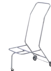
スタッキングチェア台車 MP-75-SV

□外寸法/W480×D750×H1080 □材質/スチール丸パイプ・塗装仕上 □収納台数/8脚 □重量/5.0kg □キャスター/100㊦