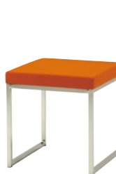
レセプションチェア MC-1104L-M

□外寸法/W440×D440×H455 □張地/ビニールレザー張り □脚部/21㊦スチールパイプ・クロームメッキ □重量/5.6kg