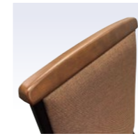
木製笠木チェア (再生木材使用)