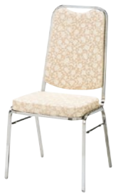
レセプションチェア MR-2H-M

□外寸法/W465×D555×H910(SH445) □張地/ビニールレザー張り □脚部/19㊦スチールパイプ・クロームメッキ □重量/6.9kg