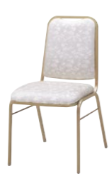
レセプションチェア MR-21-GA

□外寸法/W465×D530×H820(SH445) □張地/ビニールレザー張り □脚部/19㊦アルミパイプ・ゴールド塗装 □重量/4.7kg