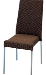
レセプションチェア MC-226-SV

□外寸法/W440×D615×H940(SH450) □張地/布張り □脚部/22.2㊦スチールパイプ・シルバー塗装 □重量/6.4kg