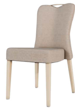
アルミニウムチェア DSCR-D59027B

□外寸法/W440×D590×H900(SH450) □張地/ビニールレザー張り・ファブリック張り □脚部/アルミニウム合金 □スタッキング/5脚程度