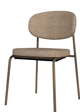
レセプションチェア DSCR-D54100

□外寸法/W485×D500×H780(SH450) □張地/ビニールレザー張り・ファブリック張り □脚部/スチール □スタッキング/4~5脚程度