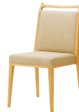
木製チェア セネカ 5N

□外寸法/W460×D560×H835(SH430) □張地/布地C □スタッキング可能 □主材/ブナ無垢材 □重量/5.5kg