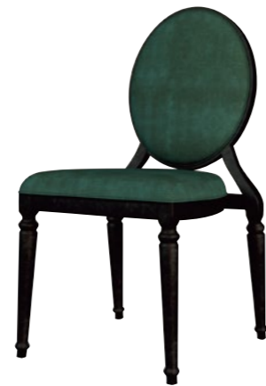
アルミニウムチェア DSCR-D53430

□外寸法/W470×D540×H885(SH450) □張地/ビニールレザー張り・ファブリック張り □脚部/アルミニウム合金 □スタッキング/4脚程度