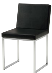
レセプションチェア MC-1103L-M

□外寸法/W440×D525×H755(SH455) □張地/ビニールレザー張り □脚部/21㊦スチールパイプ・クロームメッキ □重量/8.0kg