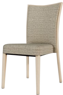
アルミニウムチェア DSCR-D51530

□外寸法/W470×D580×H915(SH450) □張地/ビニールレザー張り・ファブリック張り □脚部/アルミニウム合金 □スタッキング/5脚程度