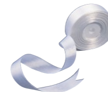
ホワイトリボンテープ