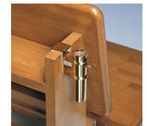
チャペルチェア用花器 CC-F