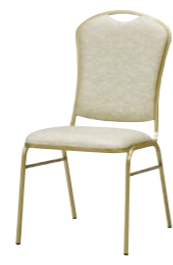
レセプションチェア MR-16-GA