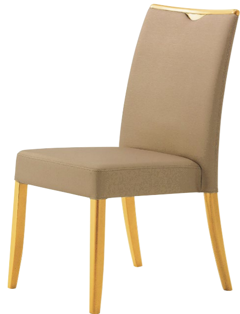
木製チェア トレン HM 5N

□外寸法/W470×D615×H870(SH430) □張地/布地:C □スタッキング可能 □主材/ブナ無垢材 □重量/6.4kg