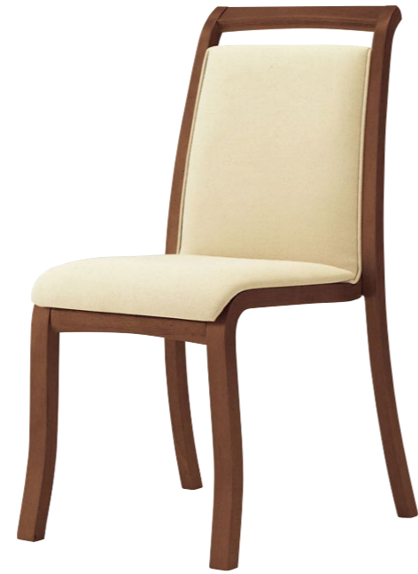
木製チェア テネル 11N

□外寸法/W475×D570×H875(SH455) □張地/布地:C □スタッキング可能 □主材/ラバーウッド成形合板 □重量/7.2kg