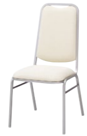
レセプションチェア MR-1H-SA