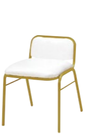
レセプションチェア MR-48-GA