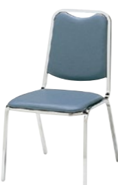
レセプションチェア MR-9-M