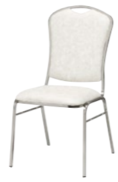
レセプションチェア MR-16-M