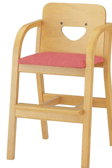
子供イス プチ 5NL

□外寸法/W440×D460×H750(SH500) □張地/レザー:B-15(No.6) □脚部/ラバーウッド無垢材 □重量/6.3kg