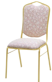
レセプションチェア MR-28-GA