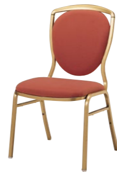
レセプションチェア CA561G