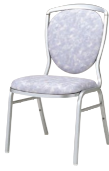
レセプションチェア CA561E