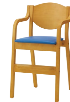
子供イス チルコ 5NL

□外寸法/W415×D470×H750(SH475) □張地/レザー:B-15(No.16) □スタッキング可能 □脚部/ラバーウッド成形合板 □重量/6.5kg