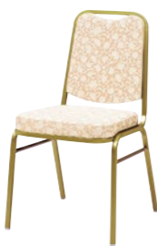
レセプションチェア MR-12-M