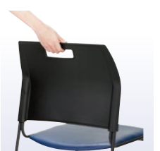
取手付 移動に便利な取手付。