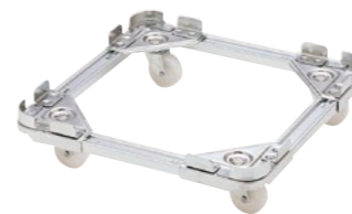
スタッキングチェア台車 EKP203