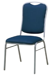
レセプションチェア MR-26-SA