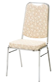
レセプションチェア MR-2H-M