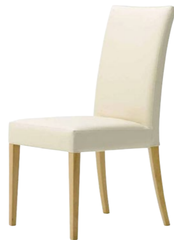
木製チェア メルカAM 5N

□外寸法/W455×D575×H905(SH450) □張地/レザー:C □主材/ブナ無垢材 □重量/5.5kg