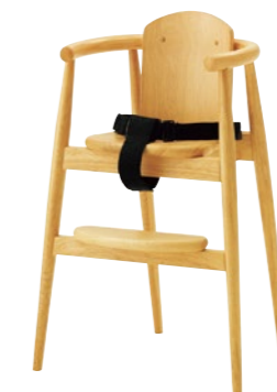
子供イス ピッケ NA

□外寸法/W480×D460×H715(SH475) □スタッキング可能 □脚部/ラバーウッド無垢材 □座/ラバーウッド成形合板 □重量/5.0kg