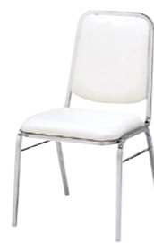
レセプションチェア MR-1-M