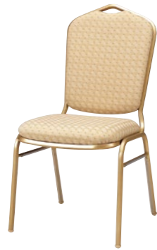
レセプションチェア CA555G