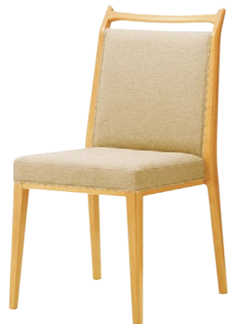
木製チェア セネカ 5N

□外寸法/W460×D560×H835(SH430) □張地/布地:C □スタッキング可能 □主材/ブナ無垢材 □重量/5.5kg