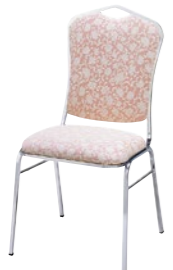
レセプションチェア MR-18-M