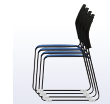
スタッキング例 (平積み4脚まで)