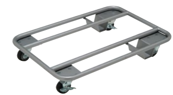
スタッキングチェア台車 SK-12