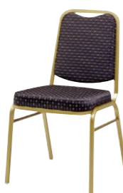
レセプションチェア MR-2-GA