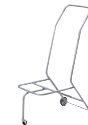
スタッキングチェア台車 MP-75-SV