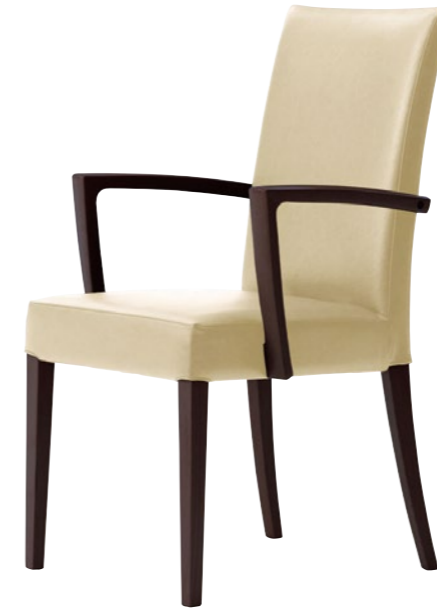
木製チェア メルカAW 1N

□外寸法/W520×D575×H905(SH450) □張地/レザー:C □主材/ブナ無垢材 □重量/6.5kg