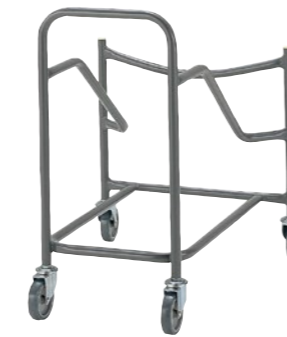
NSC-B50L 会議用チェア専用台車 DN-30